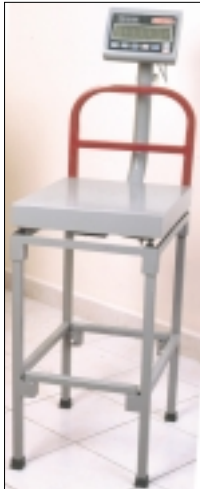
Mesa de 50 cm de alto, de sólida construcción de acero, recubierta de pintura epóxica