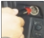
Adaptador para conectar la báscula al encendedor del automóvil.