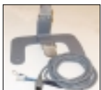
Kit para módulo remoto, incluye soporte mesa pared y extensión