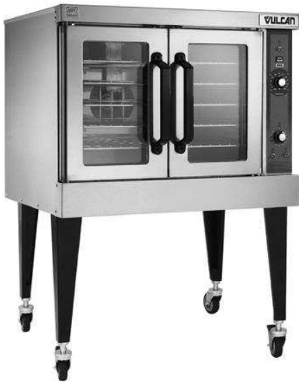
Modelo VC4GD con ruedas opcionales